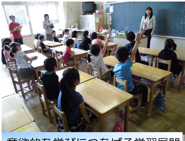
意欲的な学びにつなげる学習展開