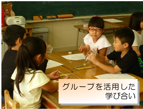
グループを活用した 学び合い

心豊かに表現し、 学び合う児童の育成 「考えを深め」「認め合う」 話し合い活動の充実を通して