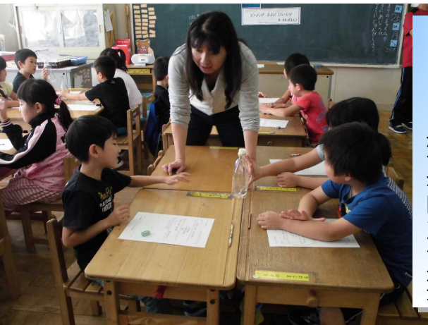
学びを支える 効果的な支援