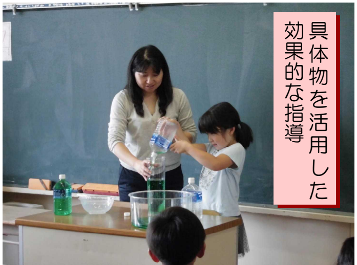
具体的な活用した 効果的な指導