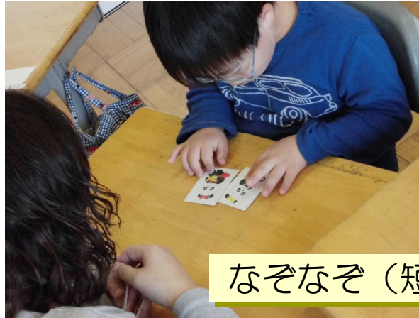
なぞなぞ(短文を集中して聞く)