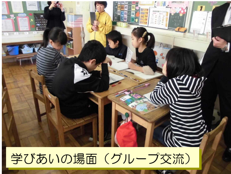
学びあいの場面（グループ交流）