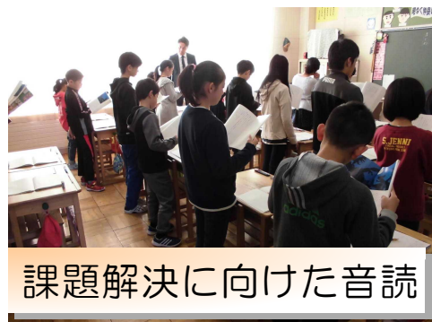
課題解決に向けた音読