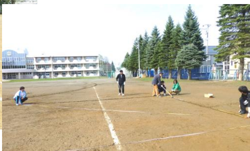
↓ グラウンド設計中の先生方

運動会に向けて、先生方がグラウンドにラインを入れました。図面を見ながら巻き尺やホーを使ったの作業でした。