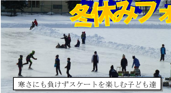
寒さにも負けずスケートを楽しむ子ども達