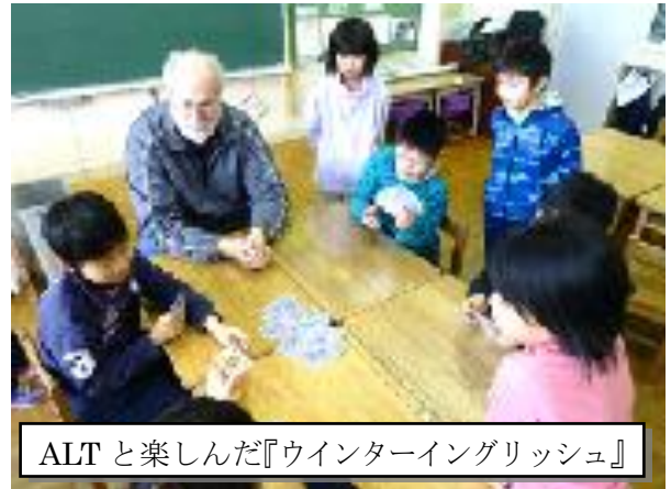
ALT と楽しんだ『ウインターイングリッシュ』