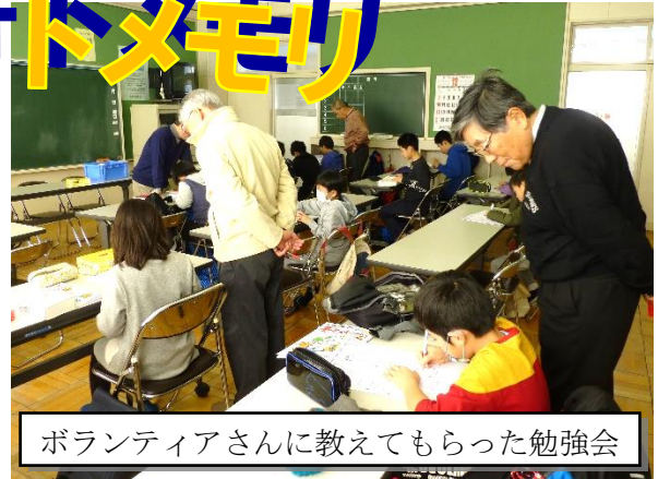
ボランティアさんに教えてもらった勉強会