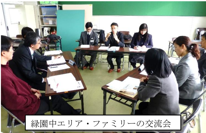
緑園中エリア・ファミリーの交流会

3校（緑園中・開西小・森の里小）の教頭と教務主任，生徒指導部長が集まって，各校の学習指導や生徒指導について交流をしました。