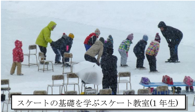
スケートの基礎を学ぶスケート教室(1年生)