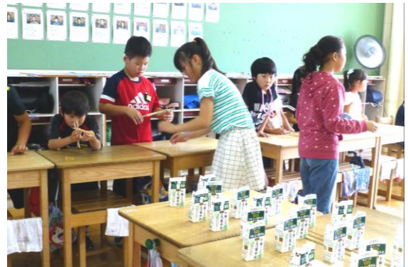
射的ブースで5年生からやり方を教えてもらう下級生