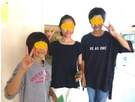
お化けのメイクを施して…。最後の『森の里まつり』を楽しむ6年生