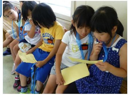
待ち時間、「どこに行ったの？」とスタンプカードを見せ合う子供達

4年生以上の各クラスでは、当日まで、全校児童が楽しめるような内容を考え協力しながら準備を進めてきました。子供達の発想力や実行力など普段見られない力が発揮されており、大変感心させられました。また、高学年が低学年を思いやる姿も見ることができ心が温くなりました。