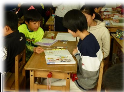
近くの友達と考えを交流し、自分の考えを深めている6年生。