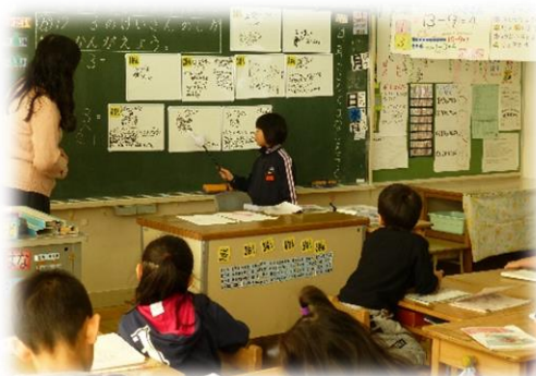
グループで話し合われたことを代表して発表する1年生。発達段階に応じた指導です。