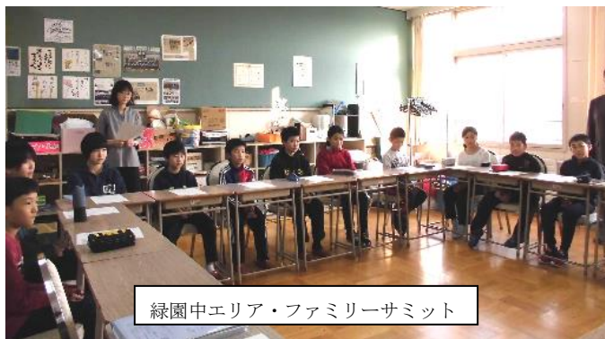
緑園中エリア・ファミリーサミット

また、いやなことをされたときに相談する相手は、低学年では「先生」、学年が上がるにつれて「父母」と回答している子どもが多くなっている傾向もありました。この結果からも、学校と家