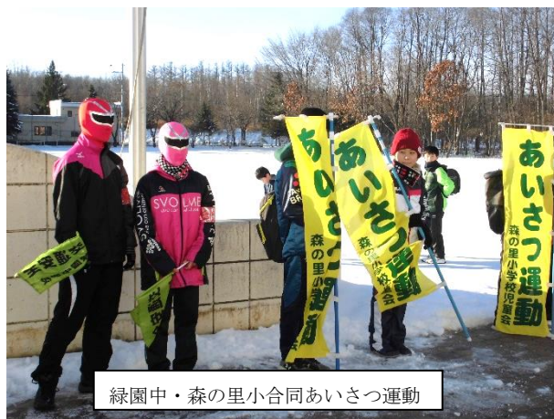
緑園中・森の里小合同あいさつ運動

さて、帯広市『小中合同いじめ・非行防止サミット』ですが、今年度2回目となった今回はエリア・ファミリーごとに行いました。緑園中学校の生徒会役員と開西小・森の里小の児童会役員が集まりあいさつ運動の行い方などの話し合いをもちました。このような子ども達の活動をとおして、エリア・ファミリーとしてもいじめ防止に取り組んでいるところです。