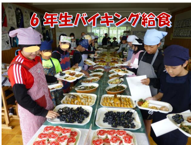
6年生バイキング給食

十月に入ってからからも、保護者の皆さんには教育活動に協力していただいています。 PTA総務部主催で行われた『親子ガラス拭き』。子ども達と一緒に、窓ガラスを一枚一枚ていねいに磨いてくれました。 また、『集団登校訓練』では、近所の子ども達がかたまつて登校するときに、温かく見守りながら一緒に登校していただきました。