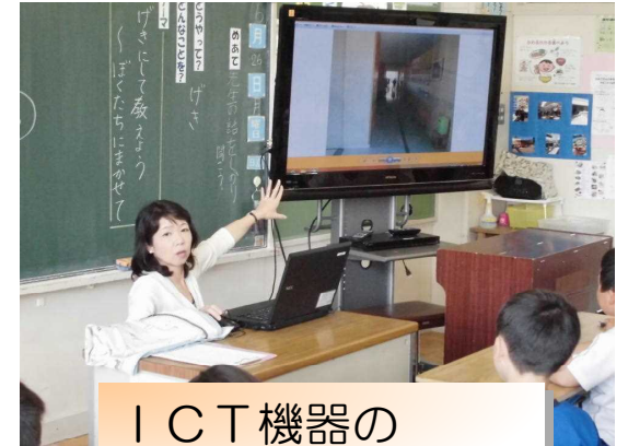
ICT機器の 効果的な活用