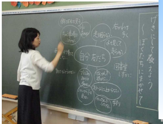
構造的な板書 (ねらいに向かって)