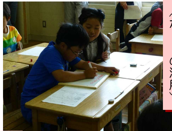
ペア交流の場面 (ボードの活用)