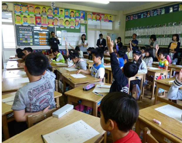
全体交流の場面 (認め合う子ども達)