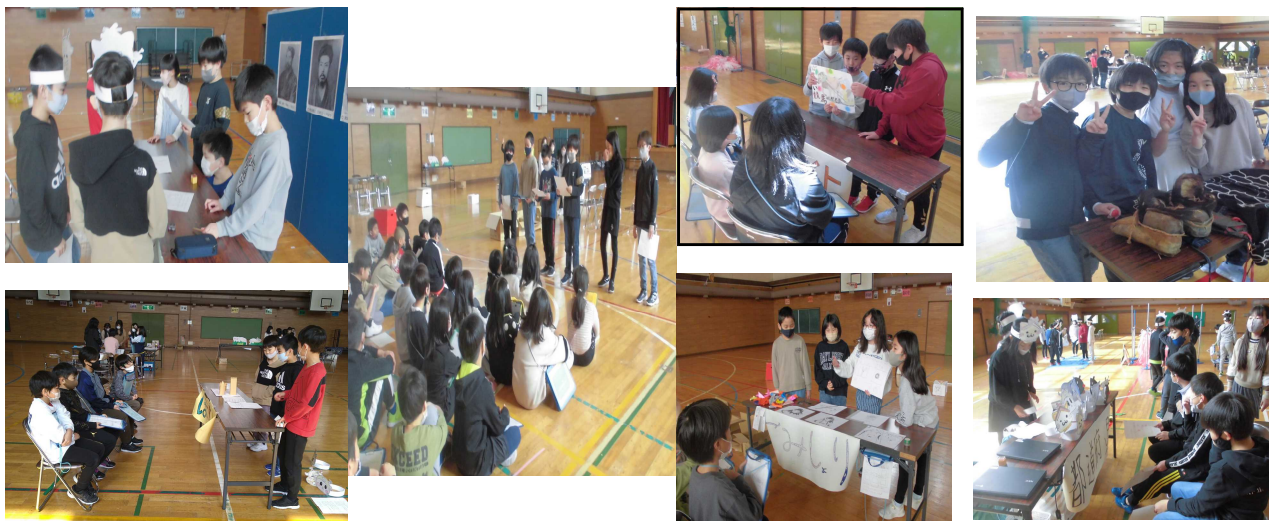
6つのブース(開拓・馬文化・アイヌの人々の文化・都道府県・ゴミ処理・防災:写真左上から時計回りに掲載しています)

3月14日(火) 3~4時間目に4年生が『社会科で学んだこと』に3年生を招待しました