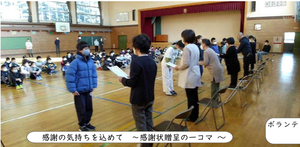
感謝の気持ちを込めて ～感謝状贈呈の一コマ～