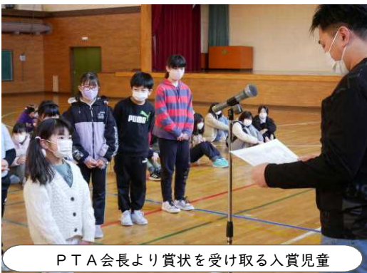
PTA会長より賞状を受け取る入賞児童

今年度も新型コロナウイルスの影響により、PTA活動は制約を受けておりますが、『できることをできるときにやる』をモットーに活動を進めてきました。今年度は、「あいさつ・いじめ防止『標語コンクール』」は、標語コンクール系の皆さんの協力を得て進めることができました。