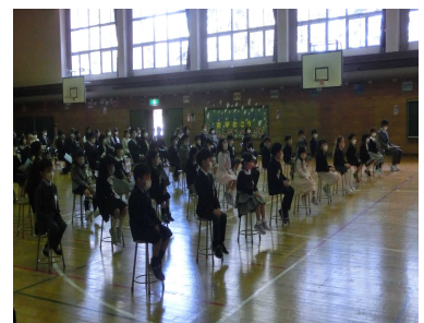
(上) わくわくどきどき!!受付にて (中) 1年生教室の黒板 (下) 入学式の様子