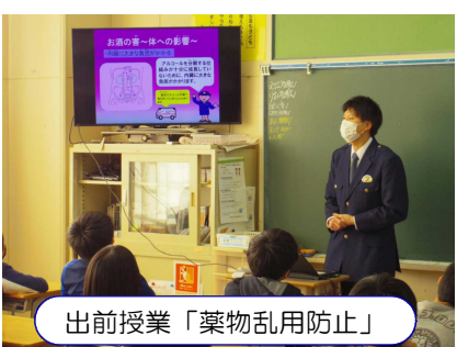
出前授業「薬物乱用防止」