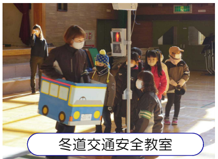
冬道交通安全教室