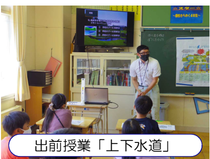
出前授業「上下水道」