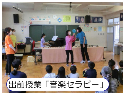
出前授業「音楽セラピー」