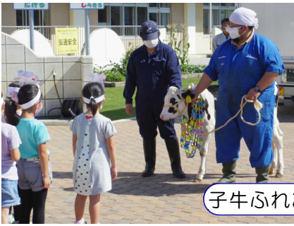
子牛ふれあいファーム（広瀬牧場様）