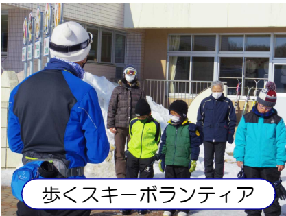
歩くスキーボランティア