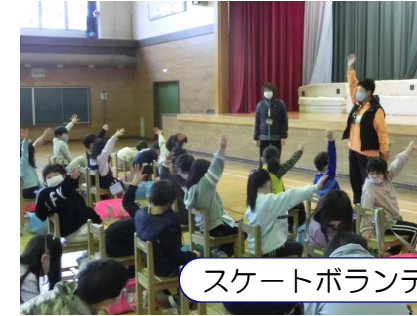
スケートボランティアの皆さん