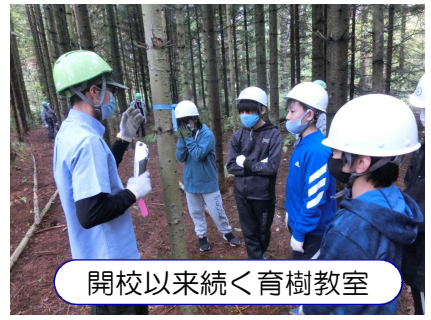
開校以来続く育樹教室