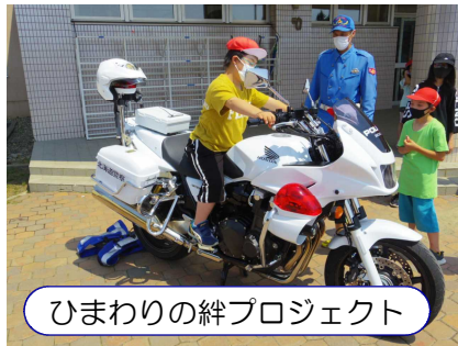
ひまわりの絆プロジェクト