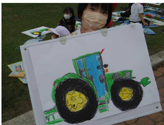
大きく描けました