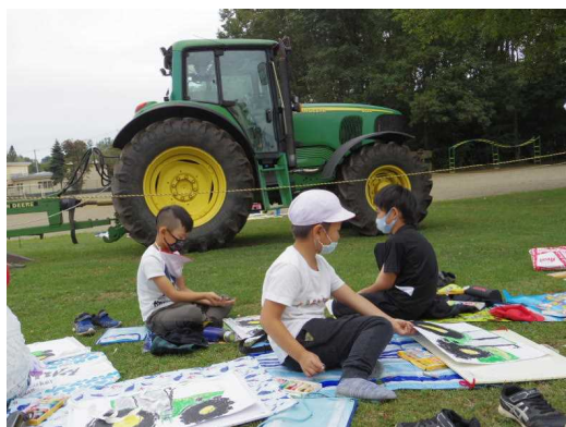
敷物を広げて写生会

遠くに見る機会はあるにしても、トラクターを間近で見るとはめったにありません。子どもたちは、その大きさに驚きながらも、画用紙いっぱい大きなトラクターを描いていました。