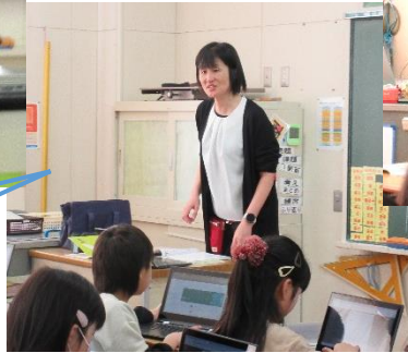
3, 4年理科担当 西主幹教諭 専科教諭ではありませんが、先 述の目的から担当しています