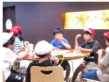
4年生 廣瀬牧場 体験学習 8/29