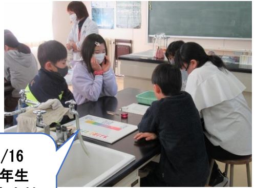
1/16 6年生 児童会館 出前授業