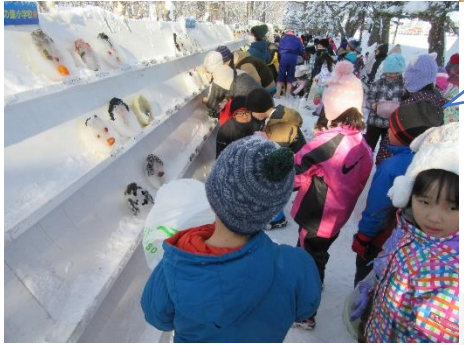
1/24 2年生 氷のお面展示