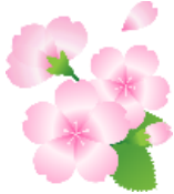
1/25 6年生 手話出前授業