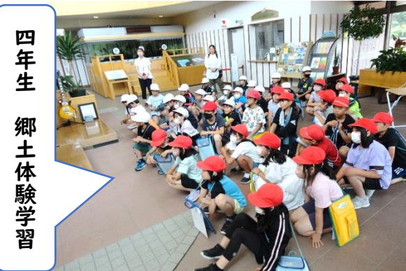
四年生 郷土体験学習