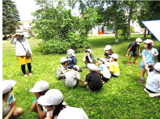
森の子ふれあい学習