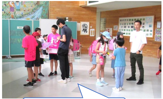
ピンクアイテムデー