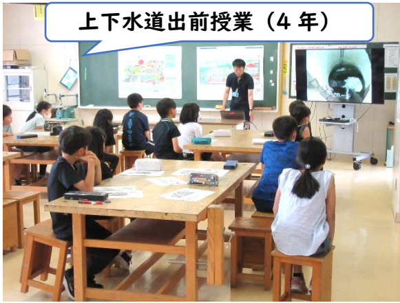
上下水道出前授業（4年）