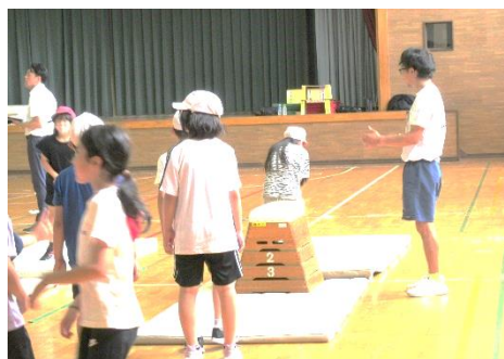
体力向上出前授業（3, 5年）