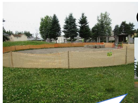
つみき公園の現在の様子