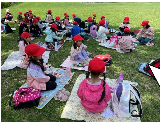
一年生 西帯広公園