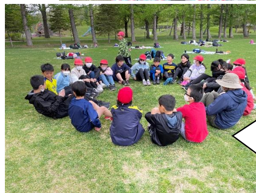
六年生 グリーンパーク