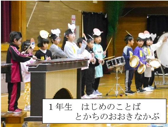
1年生 はじめのことば とかちのおおきなかぶ

子ども達の輝く表情がステキだった学習発表会。多くの保護者の皆様、ご家族の方々にお越しいただき、盛大に実施できましたこと、心より感謝申し上げます。それぞれの学年発表は学習の成果を披露する内容として工夫され、心動かされるものばかりでした。全ての演目を観ると、学年ごとの成長が明らかになる子ども達の姿でした。学習発表会で見せたそれぞれの子ども達の努力を、次のステップへとつなげていくために、今年度の後半戦に向け更に教育内容の充実を図りたいと思っております。引き続き本校の教育活動に対し、ご理解とご協力のほど、よろしくお願いいたします。