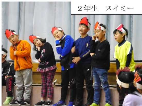
2年生 スイミー 2025