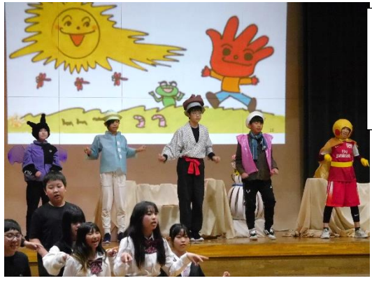
6年生 Dream Wonder Candy